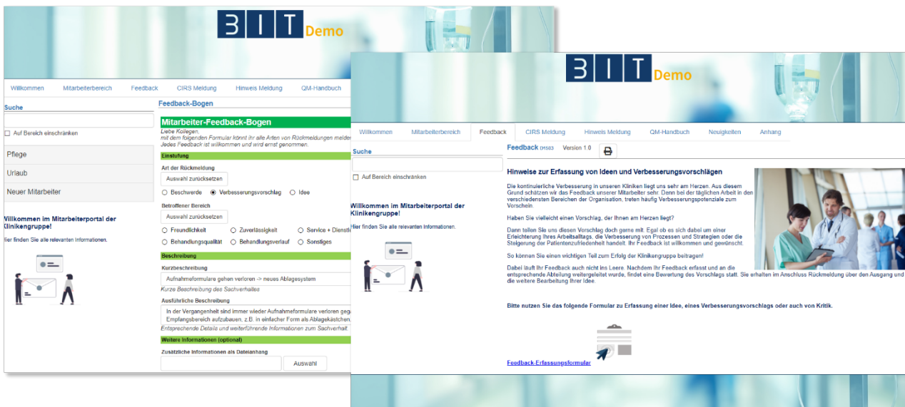
Förderung der aktiven Beteiligung der Mitarbeiter

Der Bearbeitungsprozess kann dabei frei definiert werden und beispielsweise die Bewertung des Feedbacks, die Umsetzung von Ideen oder die Durchführung von Verbesserungsmaßnahmen enthalten.